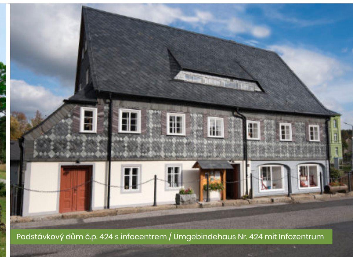
Podstávkový dům č.p. 424 s infocentrem / Umgebäudehaus Nr. 424 mit Infocentrum