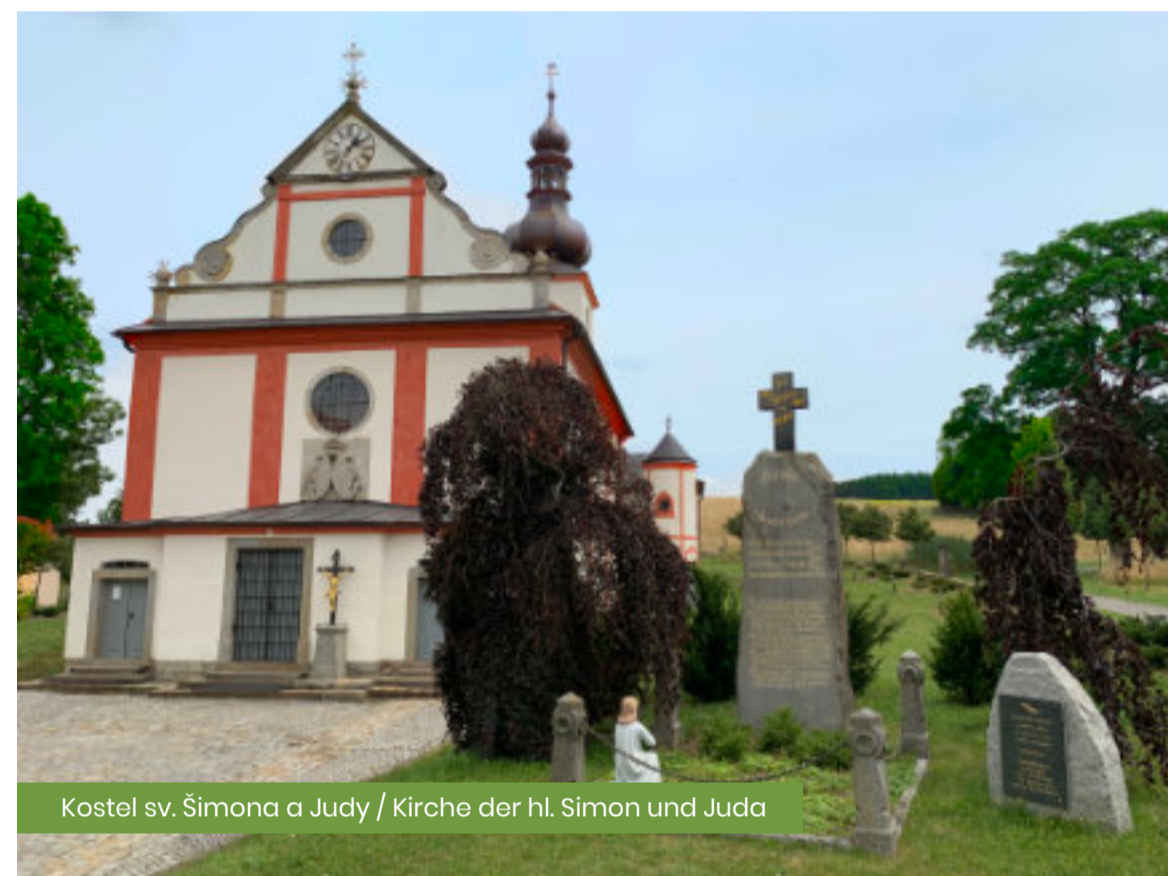
Kostel sv. Šimona a Judy / Kirche der hl. Simon und Juda