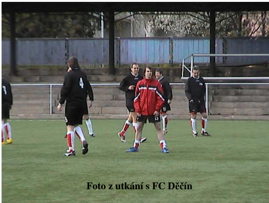
Foto z utkání s FC Děčín