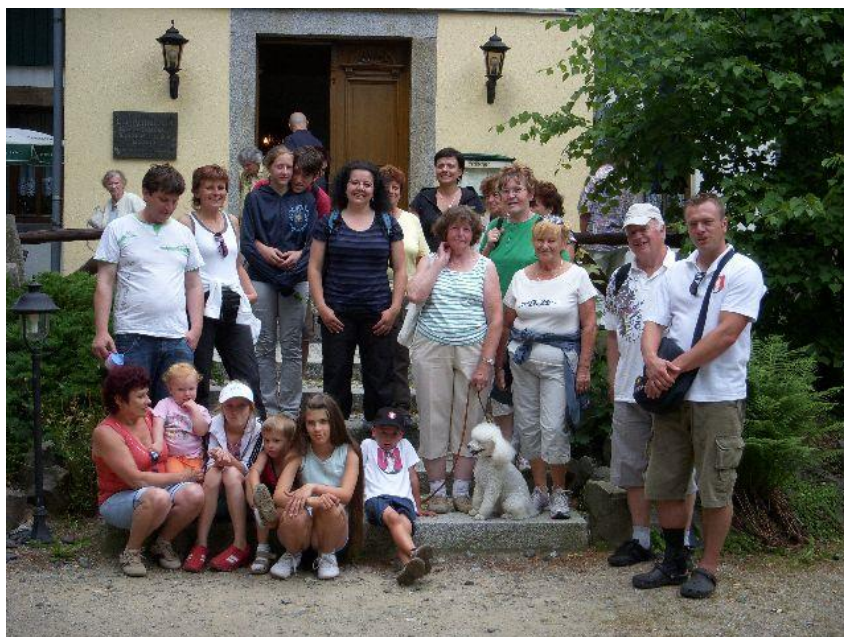
Fotografie z výletu na Sohlandskou rozhlednu

První letošní turistický výlet se bude konat 25. dubna 2010. Zamíříme na Vilémov starou alejí (dnes spíše lesem) ke křížku, dále na Markétu a okružní cestou zpět přes Vlčí prameny. Cestou se posilníme v nějakém vhodném zařízení.