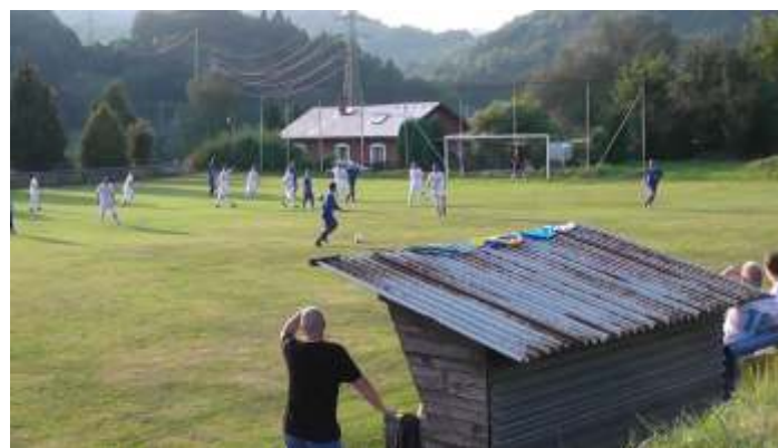
Foto z posledního utkání v Těchlovicích