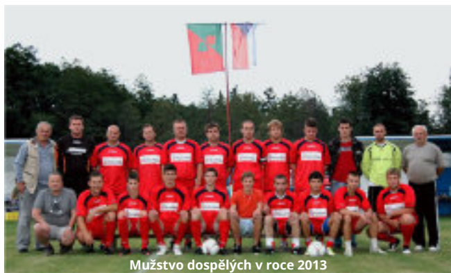
Mužstvo dospělých v roce 2013